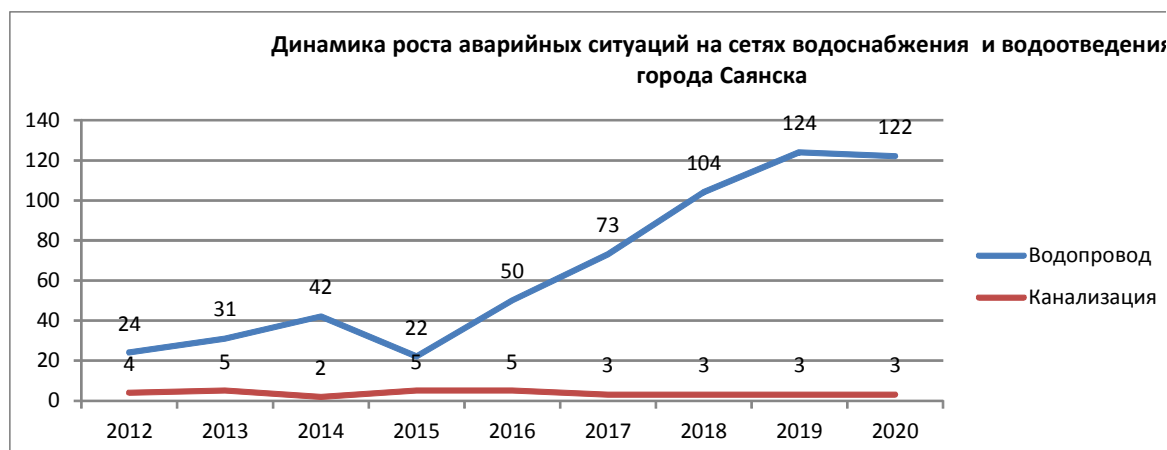
Рис. 1.2 Динамика аварийности на сетях МУП «Водоканал-Сервис».

Динамика аварийности сетей водоснабжения представлена на рис.1.2 , предоставленным эксплуатирующей организацией МУП «Водоканал-Сервис». Обращает на себя внимание факт значительного увеличения аварийности в последние годы, особенно на сетях водоснабжения.