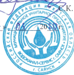
Схема водоснабжения и водоотведения городского округа муниципального образования «город Саянск» (утверждаемая часть)