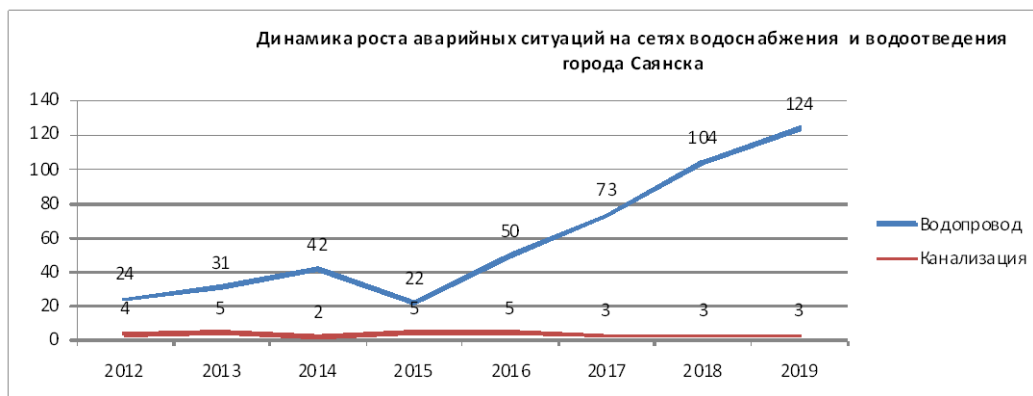
Рис. 1.2 Динамика аварийности на сетях МУП «Водоканал-Сервис».

Динамика аварийности сетей водоснабжения представлена на рис.1.2 , предоставленным эксплуатирующей организацией МУП «Водоканал-Сервис». Обращает на себя внимание факт значительного увеличения аварийности в последние годы, особенно на сетях водоснабжения.