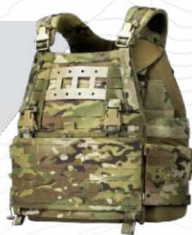
МРС 2.0 БРОНЕЖИЛЕТ Многофункциональный бронежилет с возможностью гибкой адаптации под условия применения