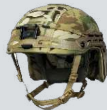
БРОНШЛЕМ ИСП. А