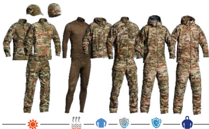
ВКПО 3.0 «Мультикам»

С 2021 по 2022 г. успешно проведена апробация комплекта обмундирования в ССО МО РФ. В ходе совместной работы с Заказчиком, на основе комплекта для специальных подразделений была создана общевойсковая версия – ВКПО 3.0. Комплект включает 8 элементов, обеспечивает возможность всесезонного использования.