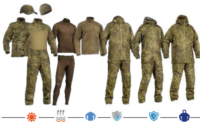
ВКПО 3.0 «Цифра»