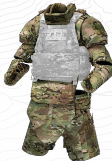
МОДУЛИ ДОПОЛНИТЕЛЬНОЙ БРОНЕЗАЩИТЫ Защита проблемных для оказания доврачебной помощи областей тела, участков, наиболее подверженных поражению осколков и вторичных поражающих элементов.