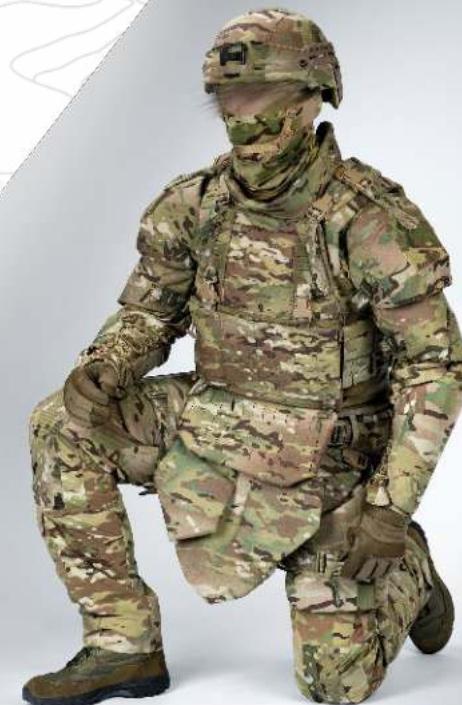
МРС 2.0 ПОЯСА