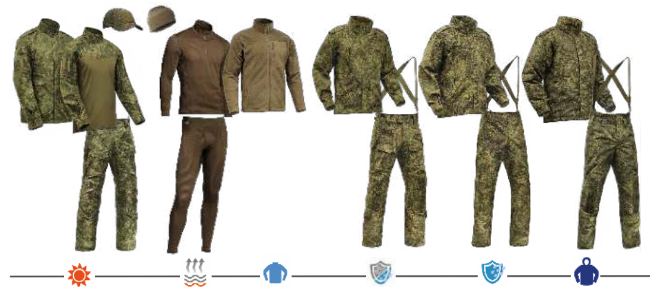
ВКПО 3.1 «Цифра»