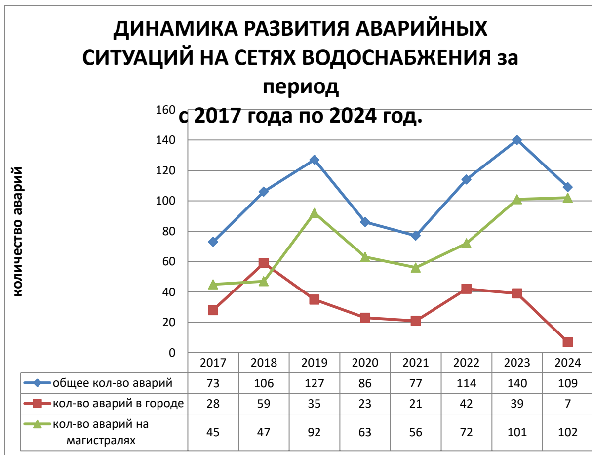
Рис. 1.2 Динамика аварийности на сетях водоснабжения МУП «Водоканал-Сервис».

Глубина прокладки трубопроводов 2,8-4 м. Грунты представлены глиной, суглинками и скальником (по основным водоводам). Аварийность на сетях водопровода возникает, в основном, по причине почвенной и электрохимической коррозии металла.